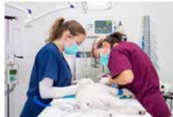
EQUIPAMIENTO MÉDICO PARA CLÍNICAS VETERINARIAS.