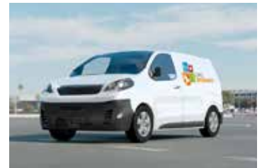
VEHÍCULOS ESPECIALES PARA EL TRANSPORTE DE ANIMALES DE COMPAÑÍA.