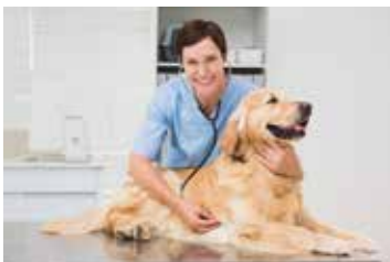
SERVICIOS GENERALES PARA VETERINARIAS Y ANIMALES DE COMPAÑÍA.