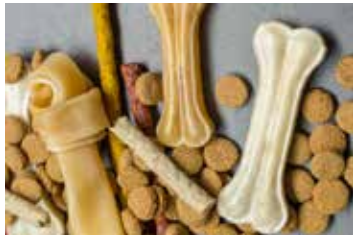
ALIMENTACIÓN Y NUTRICIÓN PARA MASCOTAS.

EXPOVETERINARIA PERÚ 2021, se convertirá en el acontecimiento anual del sector, donde dueños, empresarios y profesionales de las veterinarias, pets shops, tiendas de productos veterinarios, distribuidores, mayoristas, minoristas, servicios de grooming y todo tipo de negocio especializado en mascotas, tenga la oportunidad de tener un encuentro directo con la amplia diversidad de proveedores nacionales e internacionales del sector.