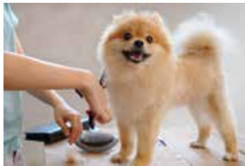
HIGIENE Y SALUD, COSMÉTICA Y BELLEZA, PELUQUERÍA Y ESTÉTICA.