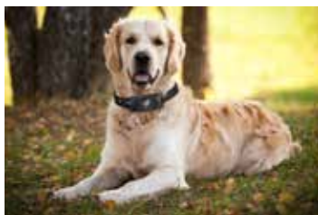
GADGETS / INNOVACIONES TECNOLÓGICAS PARA MASCOTAS.