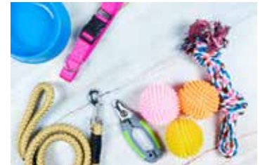
ACCESORIOS, BISUTERÍA, PRENDAS, Y HOGAR.