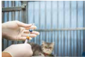
MEDICINA VETERINARIA Y FÁRMACOS PARA MASCOTAS.