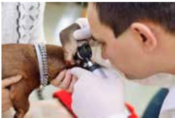
MATERIAL MÉDICO E INSTRUMENTOS VETERINARIOS.