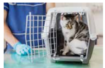
MOBILIARIO Y EQUIPAMIENTO DE HOSTELERÍA Y VETERINARIA.