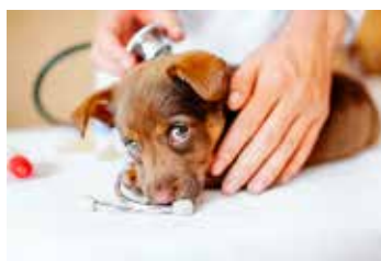
FINANCIAMIENTO VETERINARIO, PLAN Y SEGURO DE SALUD ANIMAL.