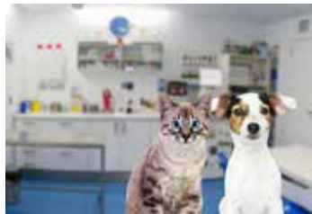
PRODUCTOS ZOO SANITARIOS, LIMPIEZA, DESINFECCIÓN Y CONTROL DE CONTAMINACIÓN.